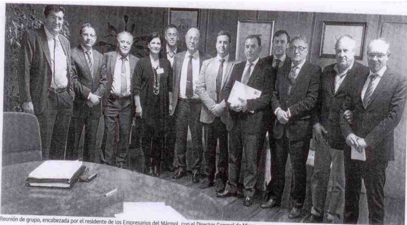
Reunión de grupo, encabezada por el residente de los Empresarios del Mármol, con el Director General de Minas.