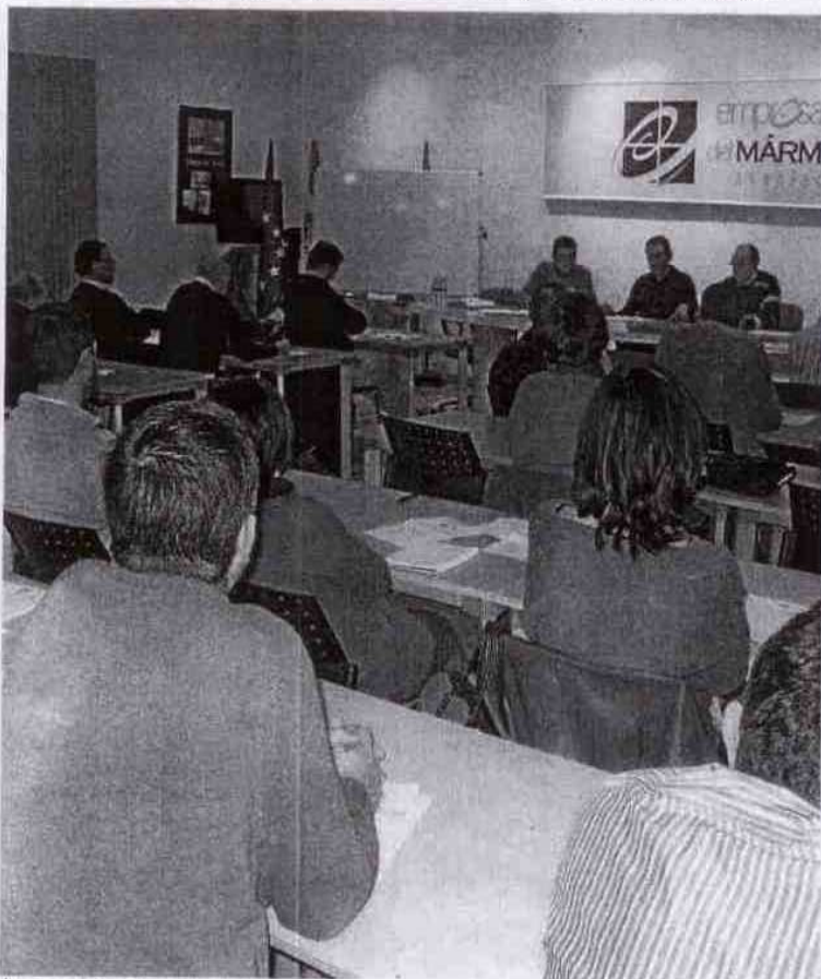
Última asamblea General. IDEAL

Por último, el presidente lanzó un mensaje a los presentes pidiendo la colaboración de todos y argumentando «sin conocimiento de los problemas, difícilmente podremos ayudar a solucionarlos. Ayúdanos a ayudarte».