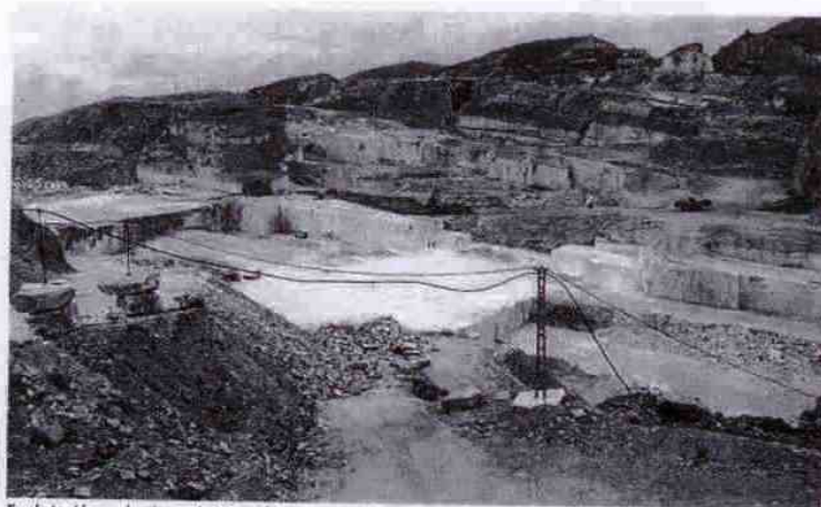
Explotación en la sierra de Macael.