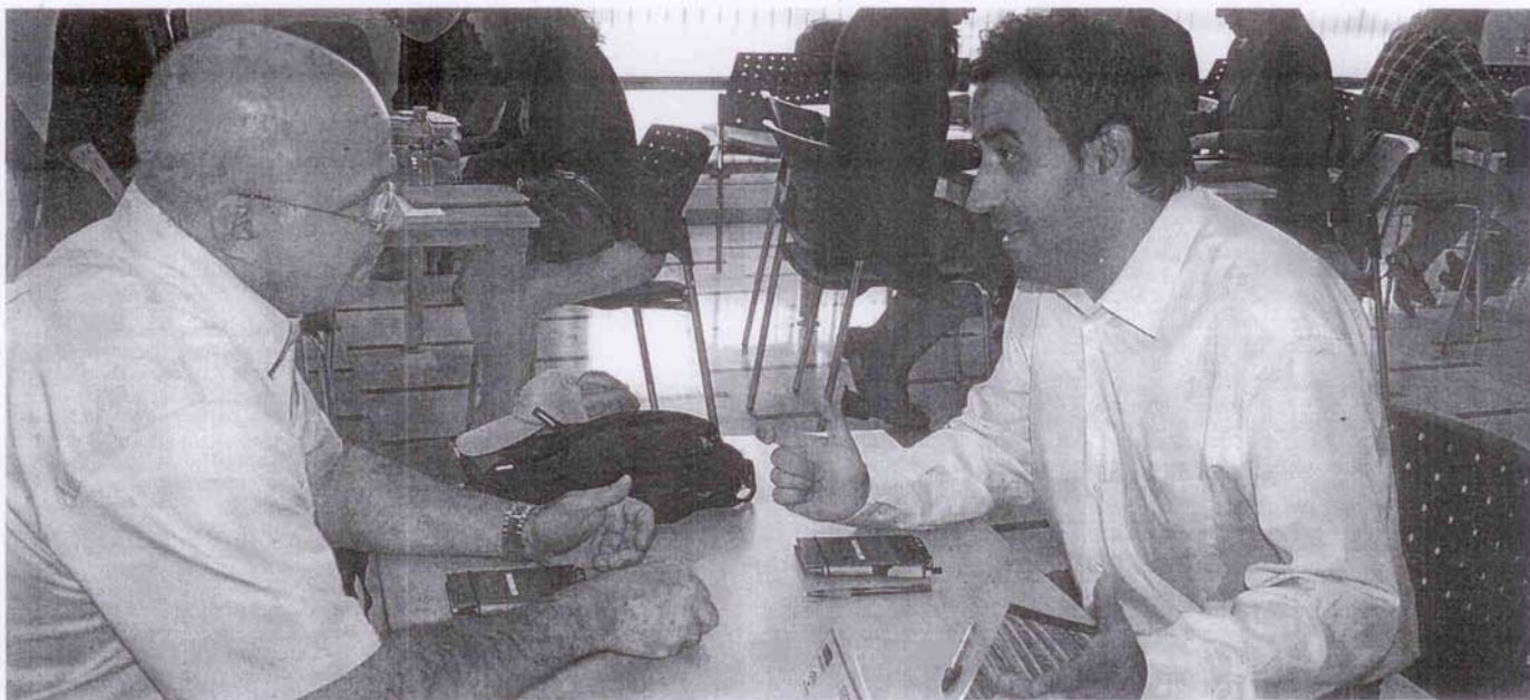
El jefe del departamento de ventas Camar charla con uno de los agentes extranjeros en la jornada. :: IDEAL