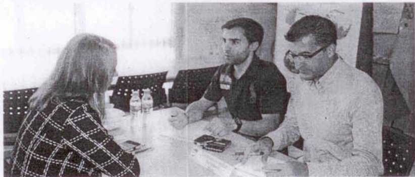
Responsables de Cosentino en el encuentro.

De las 15 firmas andaluzas participantes, 13 son de Almería: Mármoles Gutiérrez Mena, Camar, Fundación Ctap, Cuéllar, Luis Sánchez, Cementos Capa, Crumar, Design 3PCM, Cosentino, Abselen Mármoles, Mármoles Juan Tijeras, Soto Natural Stone y Grabados en Mármol. También están representadas las provincias de Jaén y Sevilla (La Alegría Mármol).